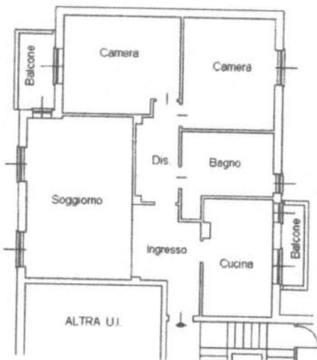
PIANO PRIMO SOTTOSTRADA - h = 2.80 mt